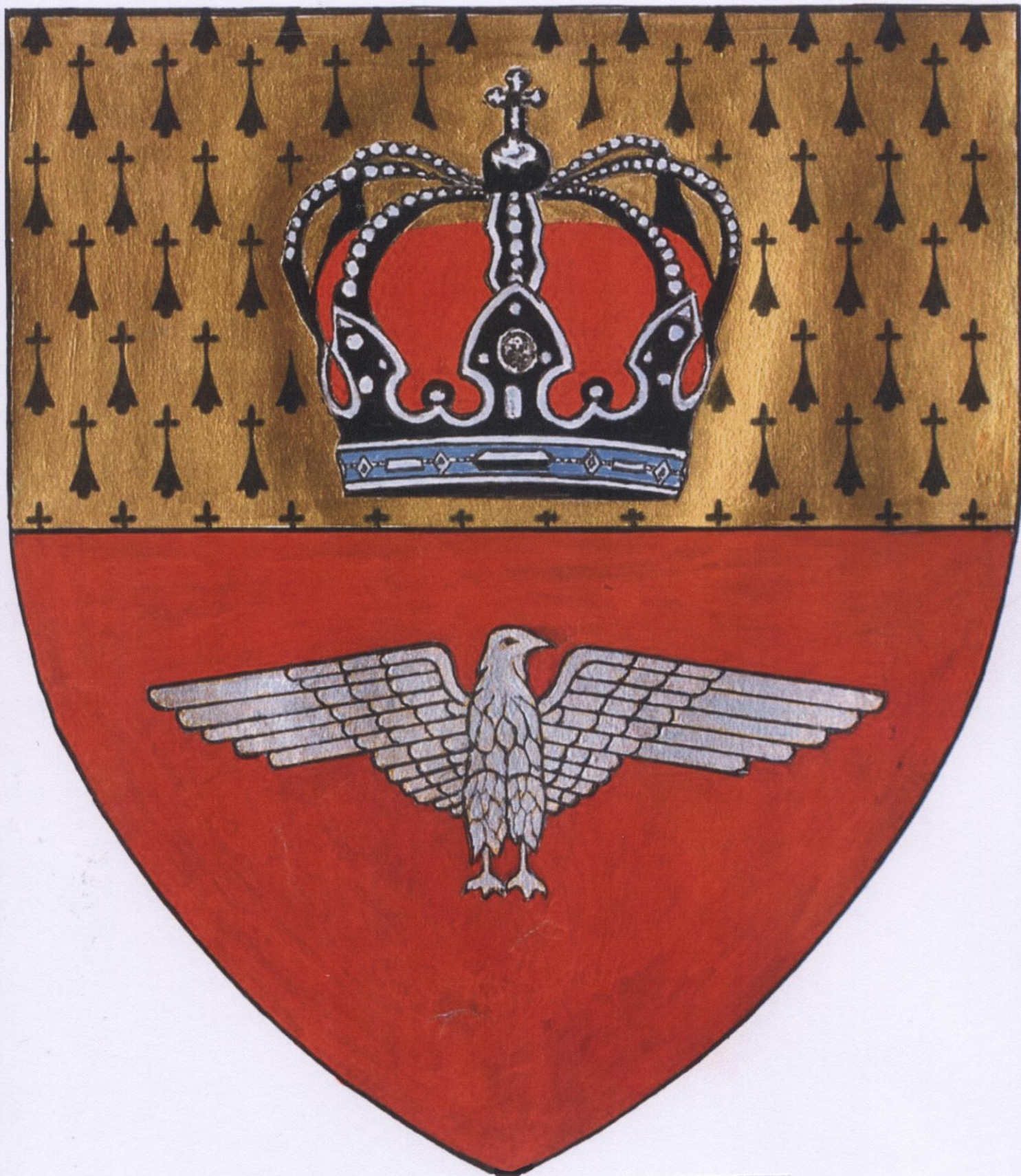
Stema Județului Alba – varianta 2