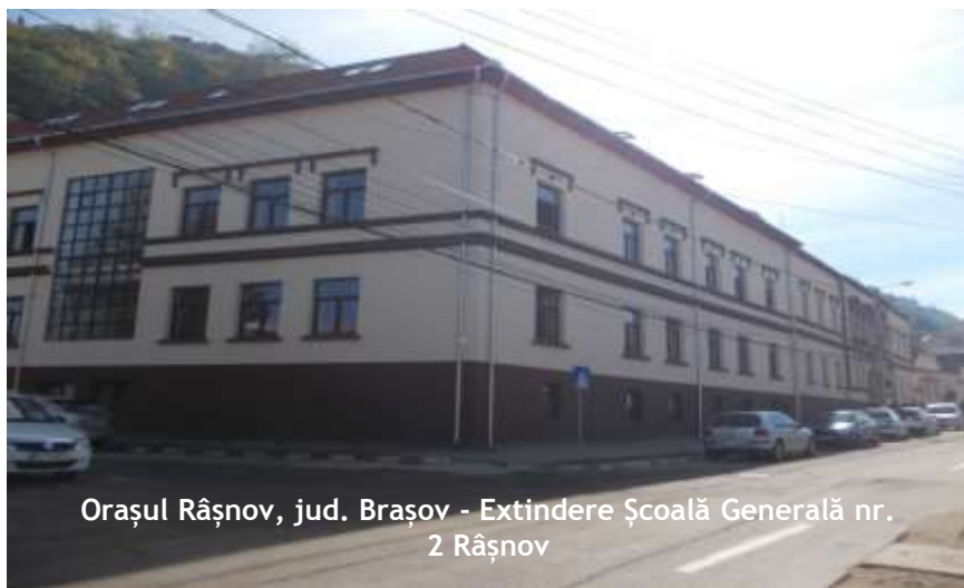
Orașul Râșnov, jud. Brașov - Extindere Școală Generală nr. 2 Râșnov