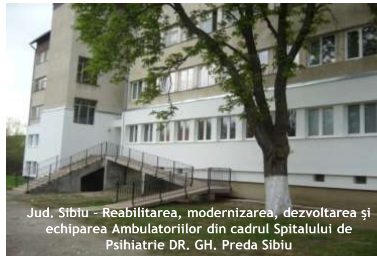
Jud. Sibiu - Reabilitarea, modernizarea, dezvoltarea și echiparea Ambulatoriilor din cadrul Spitalului de Psihiatrie DR. GH. Preda Sibiu