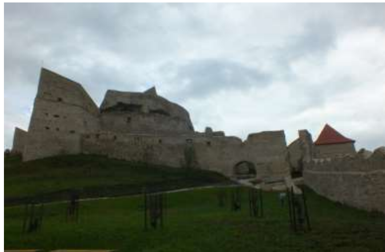
Orașul Rupea - Reabilitarea și extinderea infrastructurii turistice în orașul Rupea