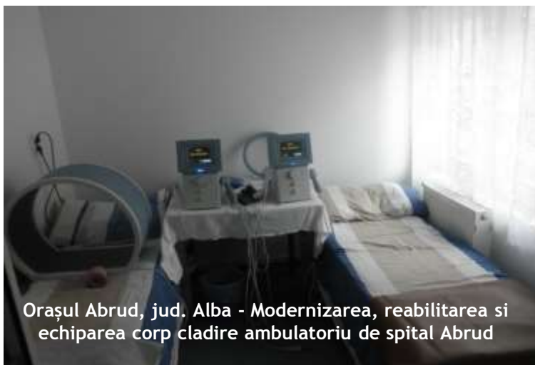
Orașul Abrud, jud. Alba - Modernizarea, reabilitarea și echiparea corp clădire ambulatoriu de spital Abrud