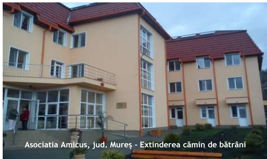
Asociația Amicus, jud. Mureș - Extinderea cămin de bătrâni