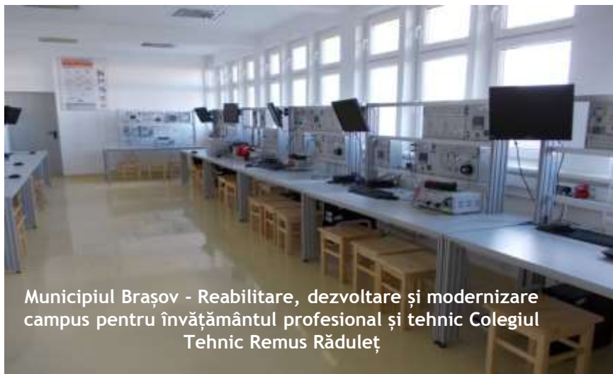
Municipiul Brașov - Reabilitare, dezvoltare și modernizare campus pentru învățământul profesional și tehnic Colegiul Tehnic Remus Răduleț