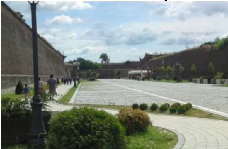
Municipiul Alba Iulia - Reabilitare Centru Istoric Traseul Estic, Traseul Sudic, Traseul Nordic Fortificația de tip Vauban - Alba Iulia - cai de acces, iluminat și mobilier urban specific