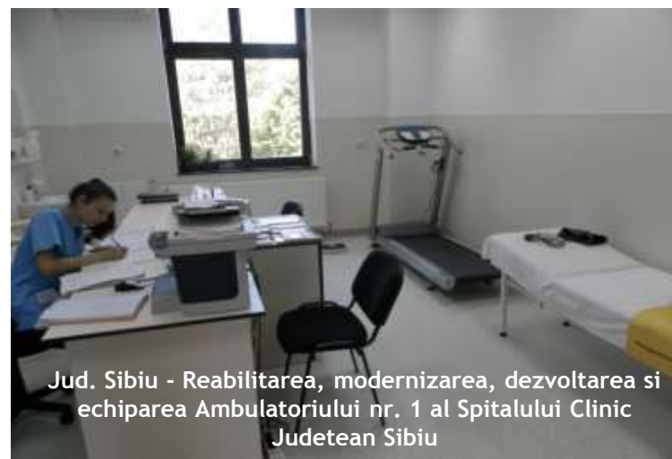
Jud. Sibiu - Reabilitarea, modernizarea, dezvoltarea și echiparea Ambulatoriului nr. 1 al Spitalului Clinic Județean Sibiu