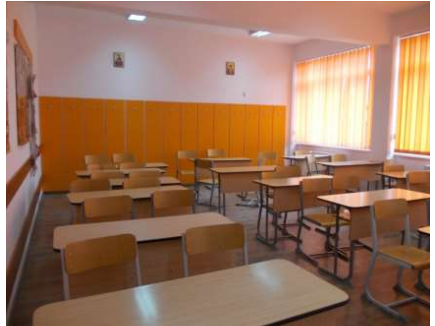
Orașul Întorsura Buzăului - Reabilitare, modernizare și extindere Liceul teoretic “Mircea Eliade”