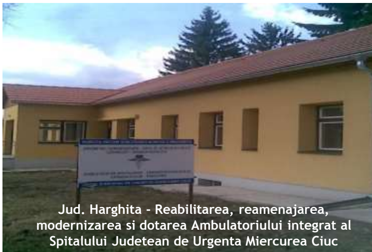
Jud. Harghita - Reabilitarea, reamenajarea, modernizarea și dotarea Ambulatoriului integrat al Spitalului Județean de Urgență Miercurea Ciuc