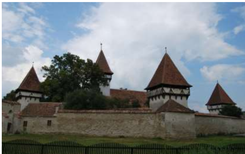
Consistoriul Superior al Bisericii Evanghelice CA din România - Tezaur Fortificate Redescoperite- Dezvoltarea durabilă a regiunii Centru prin punerea în valoare a potențialului turistic al rețelei de biserici fortificate săsești din Transilvania