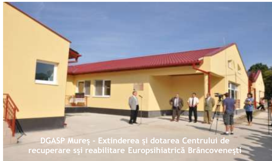
DGASP Mureș - Extinderea și dotarea Centrului de recuperare și reabilitare Europsihiatrică Brâncovenești