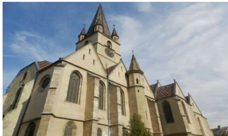
Parohia Evanghelică C.A. Sibiu - Conservarea, protejarea și punerea în valoare a monumentului patrimoniu național Biserica Evanghelică CA Sibiu prin restaurarea acoperișului clădirii