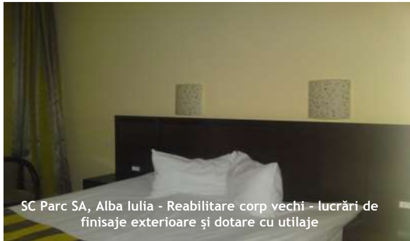
SC Parc SA, Alba Iulia - Reabilitare corp vechi - lucrări de finisaje exterioare și dotare cu utilaje