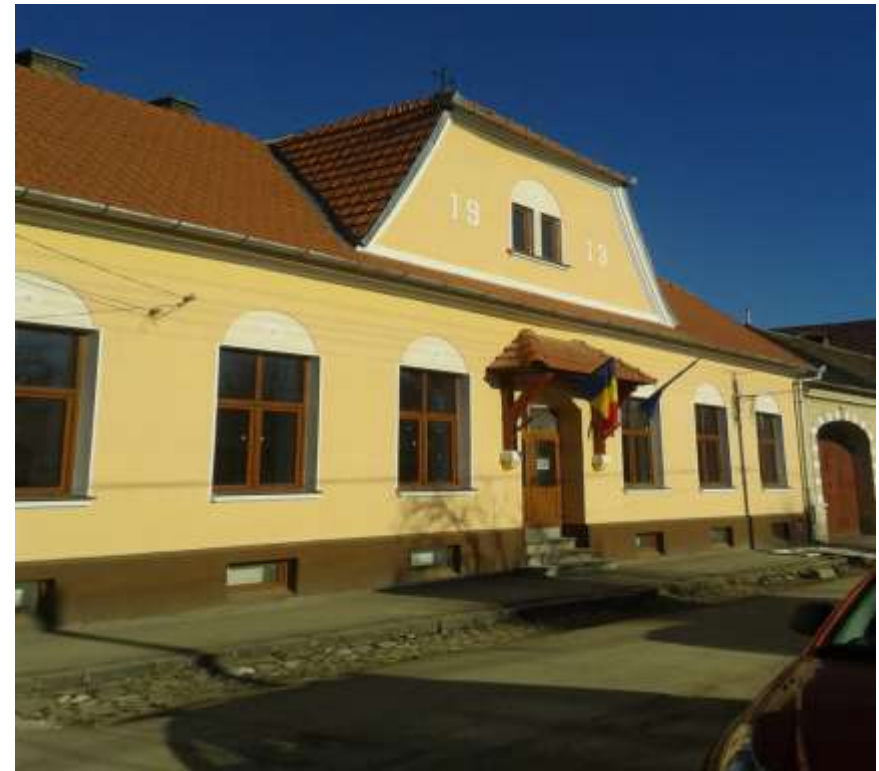
Parteneriat între Municipiul Braşov şi Comuna Vulcan- Centru Comunitar în Comuna Vulcan