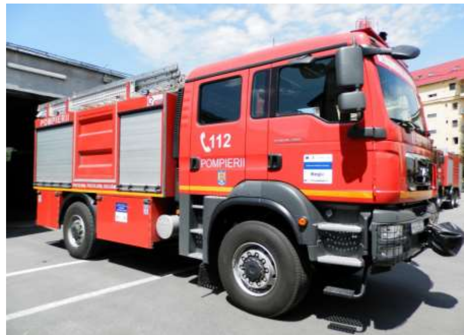
ADI Centrul Transilvaniei - Echipamente pentru îmbunătățirea intervențiilor în situații de urgență