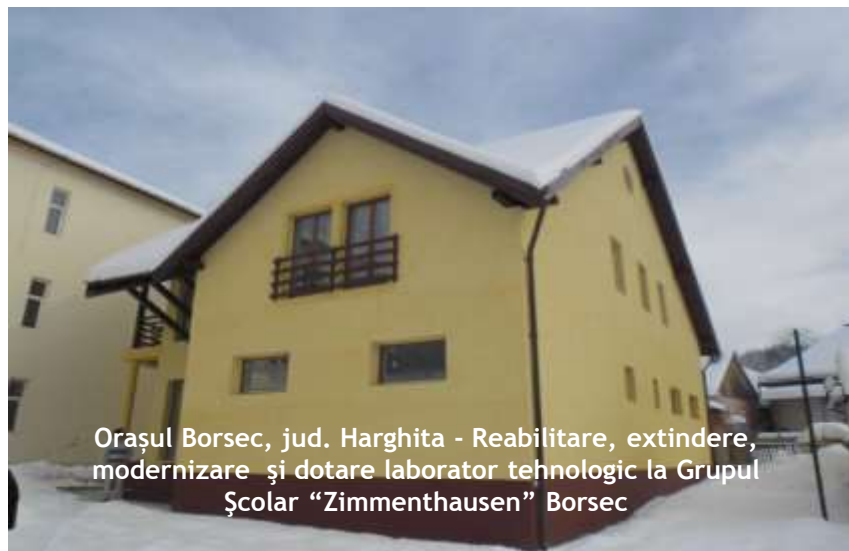
Orașul Borsec, jud. Harghita - Reabilitare, extindere, modernizare și dotare laborator tehnologic la Grupul Școlar "Zimmenthausen" Borsec