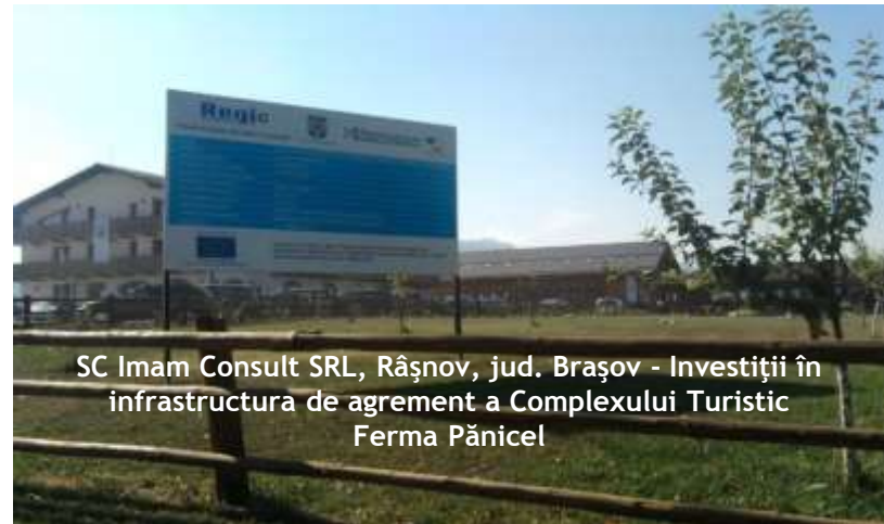
SC Imam Consult SRL, Râșnov, jud. Brașov - Investiții în infrastructura de agrement a Complexului Turistic Ferma Pănicel