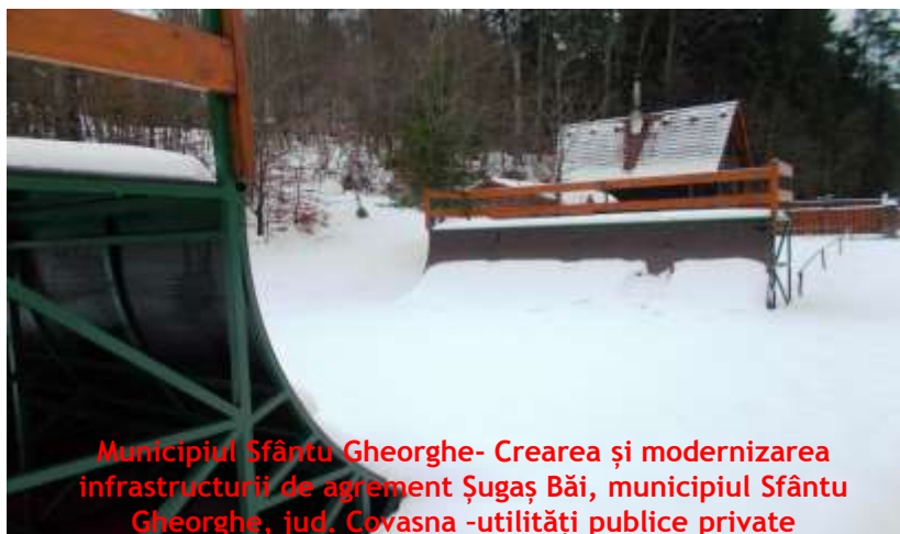
Municipiul Sfântu Gheorghe- Crearea și modernizarea infrastructurii de agrement Șugaș Băi, municipiul Sfântu Gheorghe, jud. Covasna -utilități publice private