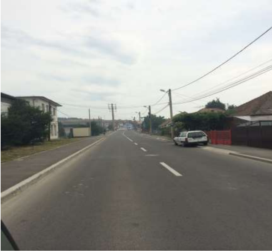
Municipiul Tîrgu Mureș - Modernizare rețea stradală la nivelul Municipiului Tîrgu Mureș