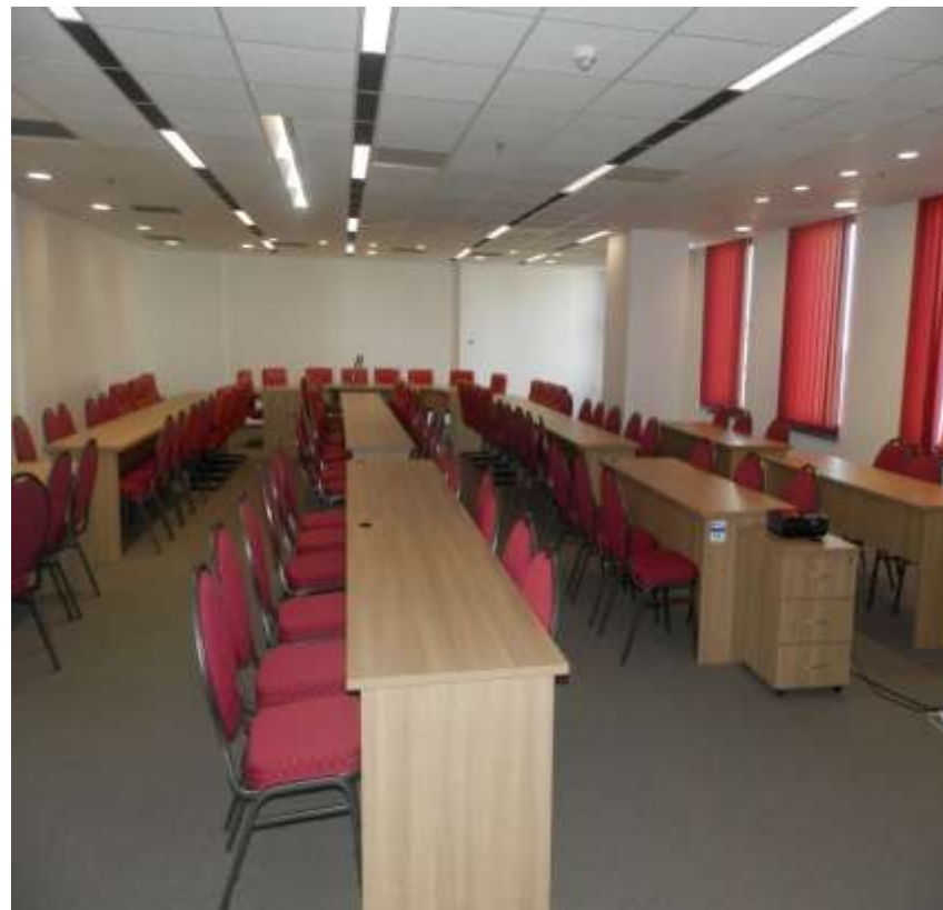
SC Transcar Internațional SRL - Centru de afaceri Sibiu