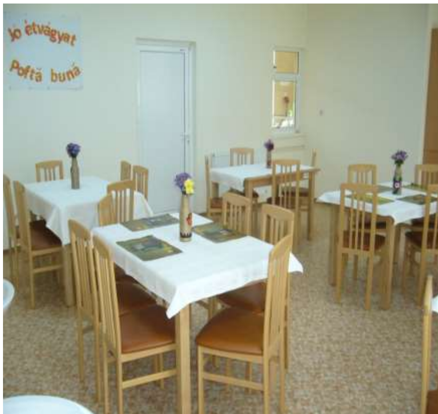
Parteneriatul dintre Comuna Sanpaul și Asociația Caritas-Asistență socială Filiala Organizației Caritas Alba Iulia - Înființarea unui nou centru social pentru persoane vârstnice în satul Valea Izvoarelor, comuna Sânpaul, județul Mureș