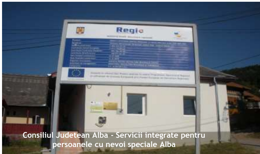
Consiliul Județean Alba - Servicii integrate pentru persoanele cu nevoi speciale Alba