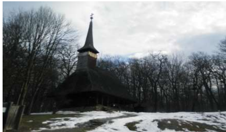
Județul Sibiu- Crearea și modernizarea infrastructurii de valorificare turistică a patrimoniului cultural al Muzeului Civilizației Populare Tradiționale din Dumbrava Sibiului