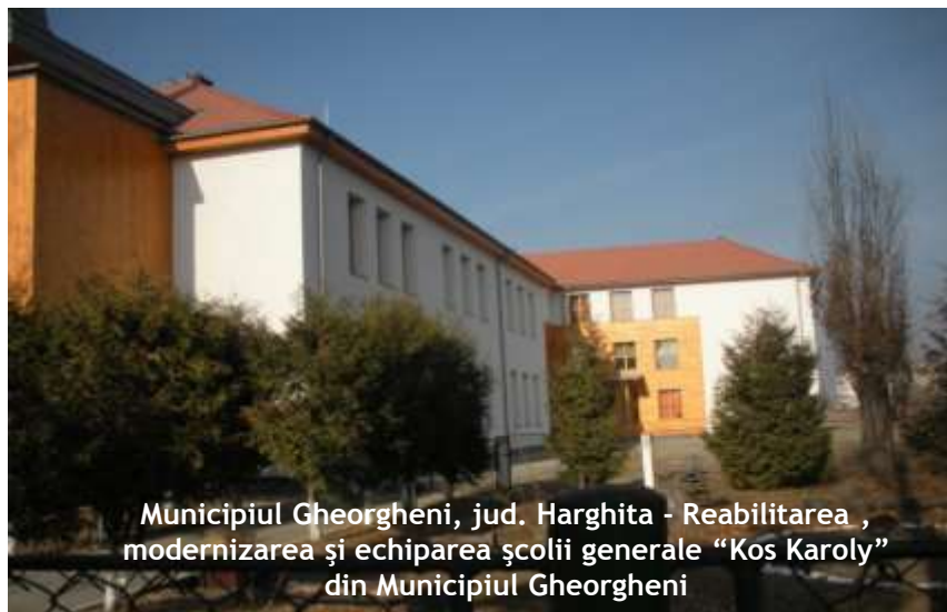
Municipiul Gheorgheni, jud. Harghita - Reabilitarea , modernizarea și echiparea școlii generale "Kos Karoly" din Municipiul Gheorgheni