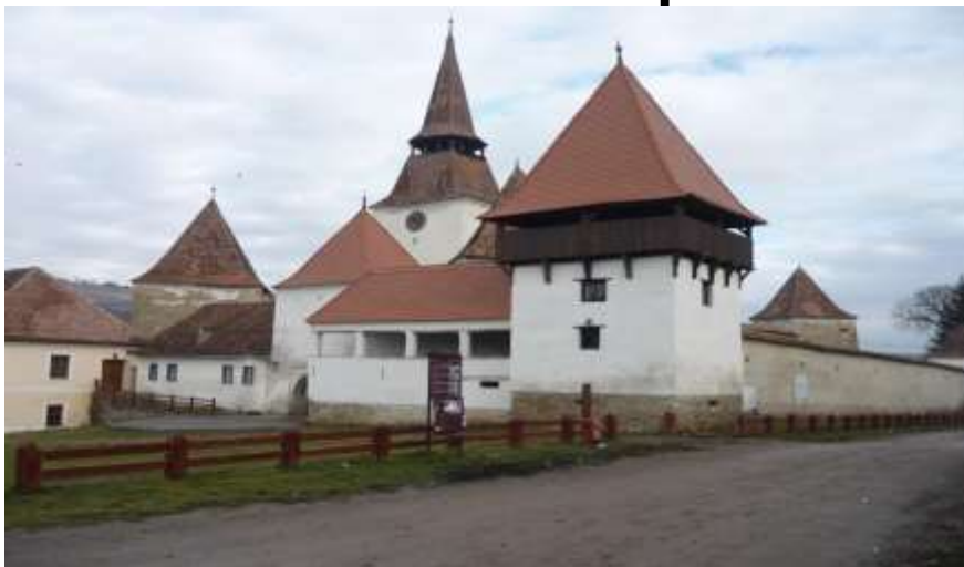
Consistoriul Superior al Bisericii Evanghelice CA din România - Tezaur Fortificate Redescoperite - Dezvoltarea durabilă a Regiunii Centru prin punerea în valoare a potențialului turistic al rețelei de biserici fortificate săsești din Transilvania