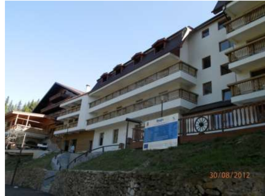
SC PĂLTINIŞ SA, Sibiu - Modernizare şi extindere hotel Casa Turiştilor