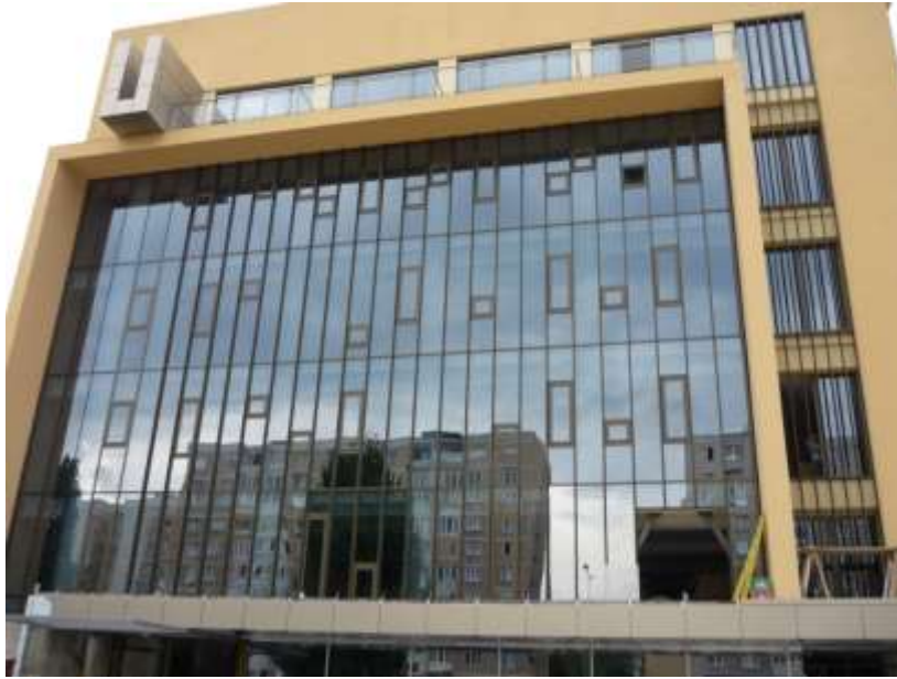
SC MADISON COMPANY SRL, Braşov - Dezvoltarea calităţii serviciilor turistice prin extinderea capacităţii de cazare şi modernizarea Hotelului Oliver din cadrul SC Madison Company SRL