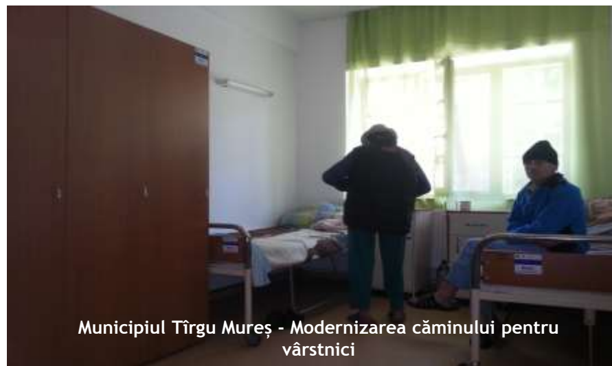
Municipiul Tîrgu Mureș - Modernizarea căminului pentru vârstnici