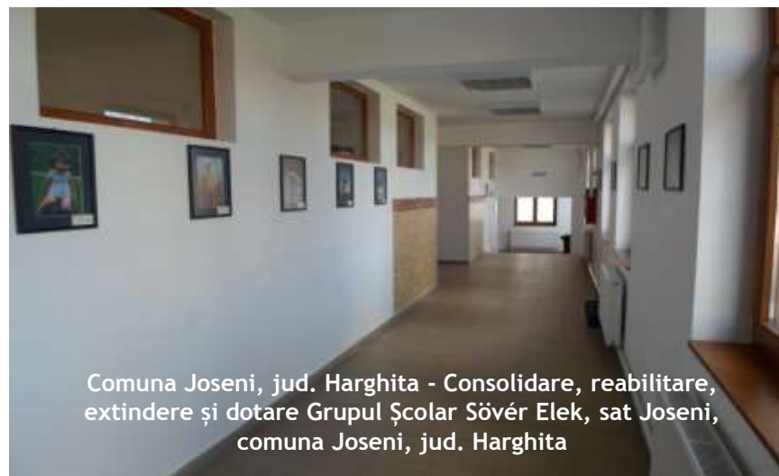
Comuna Joseni, jud. Harghita - Consolidare, reabilitare, extindere și dotare Grupul Școlar Sövény Elek, sat Joseni, comuna Joseni, jud. Harghita