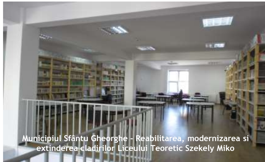
Municipiul Sfântu Gheorghe - Reabilitarea, modernizarea și extinderea clădirilor Liceului Teoretic Szekely Miko