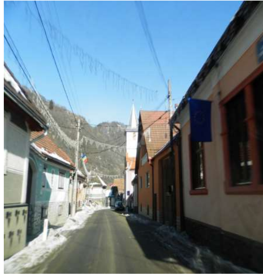
Jud. Sibiu - Modernizare DJ 105G Sadu-Râu Sadului-Sădurel, km 21+250-41+425