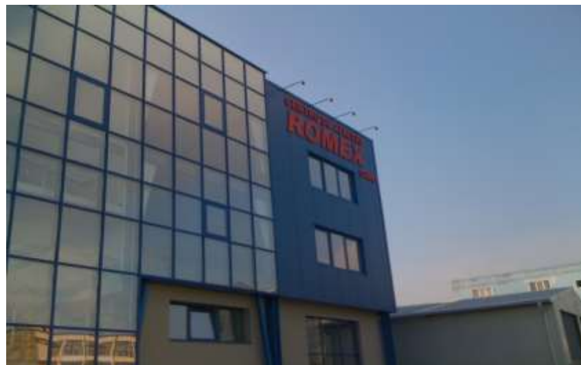
S.C. ROMEX S.R.L Tîrgu Mureș - Înființare centru de afaceri de către SC Romex SRL