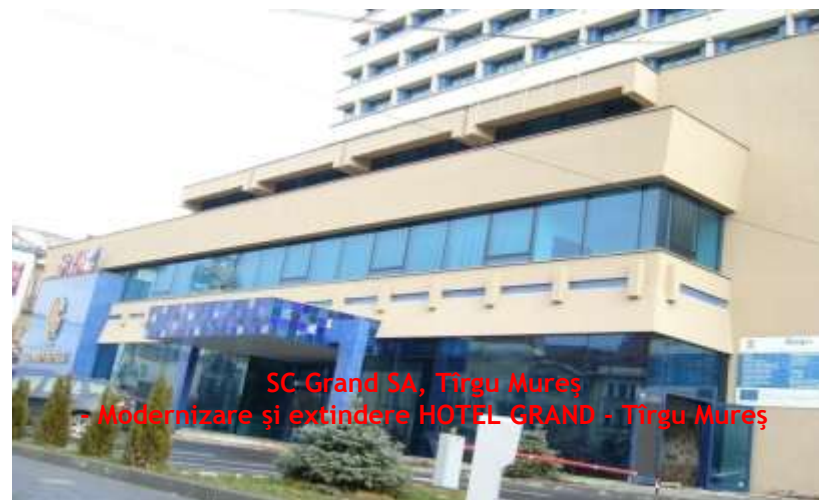
SC Grand SA, Tirgu Mures - Modernizare și extindere HOTEL GRAND - Tirgu Mures