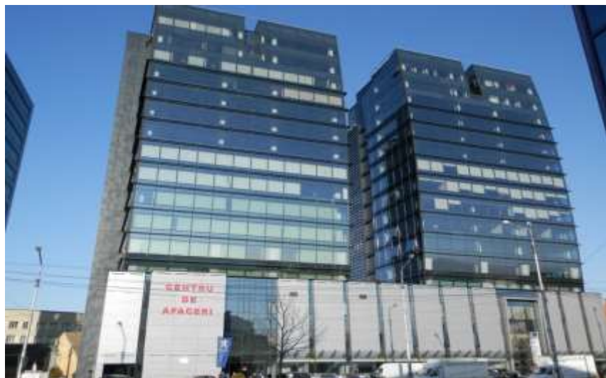
S.C. TRANSCAR INTERNAȚIONAL S.R.L - Centru de afaceri Sibiu