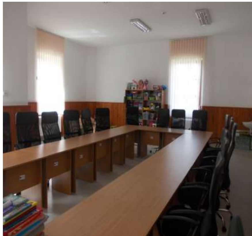
Municipiul Săcele, jud. Brașov - Reabilitare clădire centru de zi pentru copii aflați în situații de risc