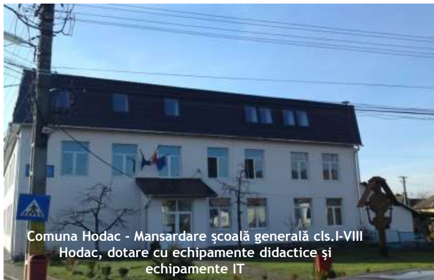
Comuna Hodac - Mansardare școală generală cls.I-VIII Hodac, dotare cu echipamente didactice și echipamente IT