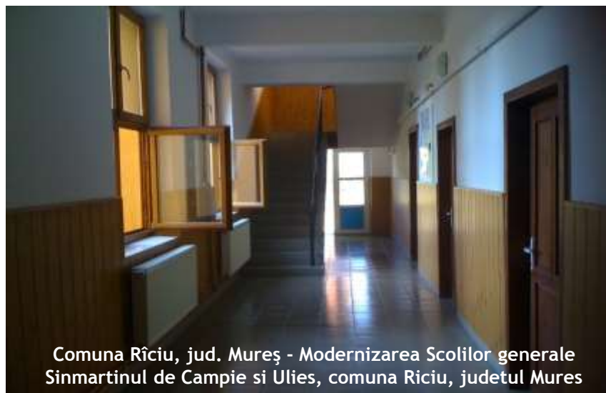
Comuna Rîciu, jud. Mureș - Modernizarea Scolilor generale Sinmartinul de Campie si Ulies, comuna Riciu, judetul Mures