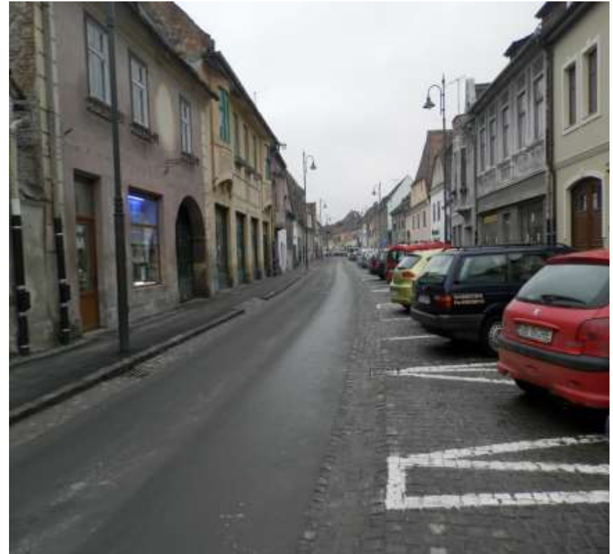
Municipiul Sibiu - Modernizare strada 9 Mai