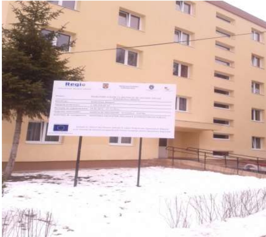
Municipiul Braşov- Reabilitare clădire cu destinaţie de locuinţe sociale în Municipiul Braşov